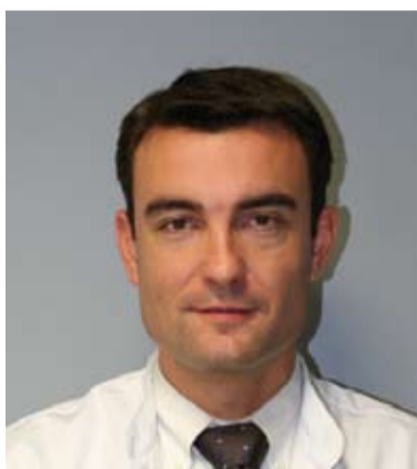
par le Dr Nicolas JACQUOT Chirurgie du Sport et Traumatologie Arthroscopie et Prothèses Epaule - Hanche - Genou

A l'heure actuelle, les techniques de mise en place de prothèse articulaires, quel que soit l'articulation, tendent à se diriger vers des techniques mini-invasives respectant mieux les tissus « mous » (muscles, tendons, ligaments...) et l'utilisation d'implants de moins en moins volumineux visant à conserver le maximum d'os du patient.